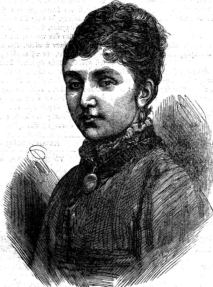
ΜΑΡΙΑ βασίλισσα της Ισπανίας.

φανῆ η ημέρα, και ανεζήτει εις τὸ σκοτός δια του ψύχους και της χιόνος, την προς τὰ ψυχρά πλυσταρεία των πελατών αυτής άγουσαν όδαν, τρέμουσα δέ εκ του ψύχους ήπλωνεν εν ύπαίθρῳ τὰ υγρά ένδύματα, πεπηγότα ήδη εις τους δακτύλους της. Αμα δέ η έσπέρα εφθανεν επέστρεψε κάθυγρος και τρέμουσα, φέρουσα και την μικράν άντιμισθίαν την όποιαν μετά τοσούτου κόπου εκέρδησεν, εις την οικίαν της, την όποιαν συνήθως εύρισκε σκοτεινήν και ψυχράν, διότι ο εκ της ασθενείας καταβεβλημένος σύζυγός της δέν ήδύνατο ν' ανάψη ουχι μόνον πυρ άλλ' ουδέ φῶς. Πολλάκις επέστρεφεν εις τον οίκόν της σχεδόν τροχάδην, διότι ο φόβος μήπως βραδυήν έτάχυνε τὰ βήματά της. Επί εξ όλας εβδομάδας μόνον ανά πάσαν Κυριακήν έβλεπε τον σύζυγον και τὸ τέκνον της την ημέραν, τας δέ λοιπας ημέρας εις τὸ άμυδρόν φῶς της λυχνίας.