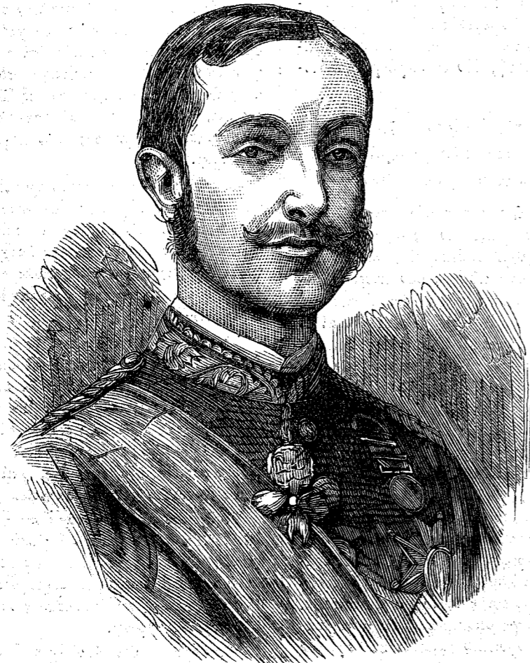
ΑΛΦΟΝΣΟΣ βασιλεύς της Ισπανίας

Η προσδοκία δέν έπετελέσθη άκριβώς· αλλά μία έγγονή του άποθανόντος βασιλέως των Γάλλων, ως βλέπομεν, ήλθε να συμερισθή τον ισπανικόν θρόνον μετά του υιού της βασίλισσης Ισαβέλλας, αλλά και αυτή δέν άπήλασεν επί πολυ της δόξης ταύτης. Η νεαρά βασίλισσα Μαρία, η Mercedes, ως οι Ισπανοί την άπεκάλουν, άπέθανεν εν ηλικία είκοσι έτων.